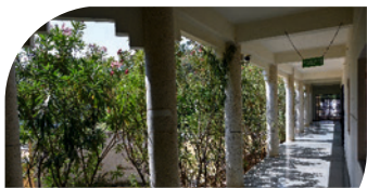
પુરુષો અને સ્ત્રીઓ માટે અલગ સારવાર વિભાગો