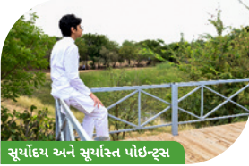
સૂર્યોદય અને સૂર્યાસ્ત પોઇન્ટ્સ