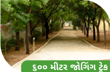
૬૦૦ મીટર જોગિંગ ટ્રેક