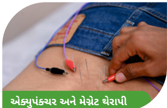
એક્યુપંકચર અને મેગ્નેટ થેરાપી