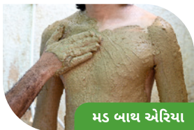
મડ બાથ એરિયા